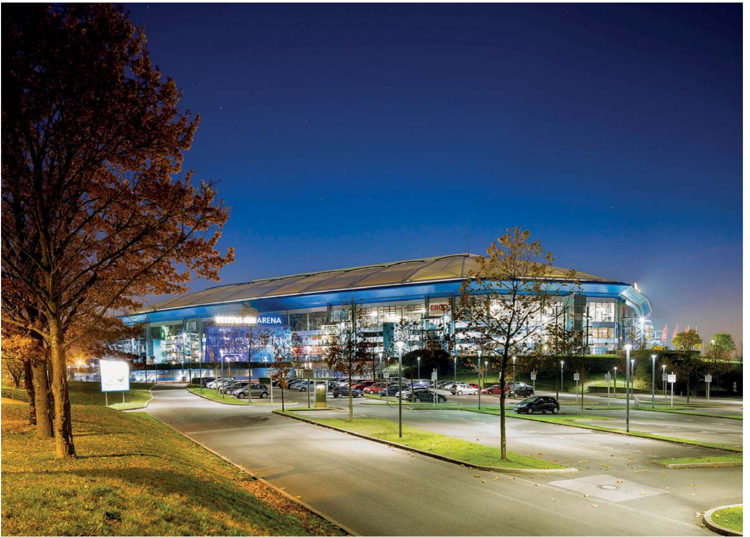
Fotografie Pressefotos FC Schalke 04 Arena